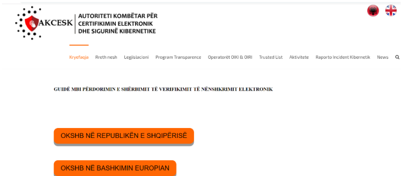
Fig2. Vendi ku operon OKSHB