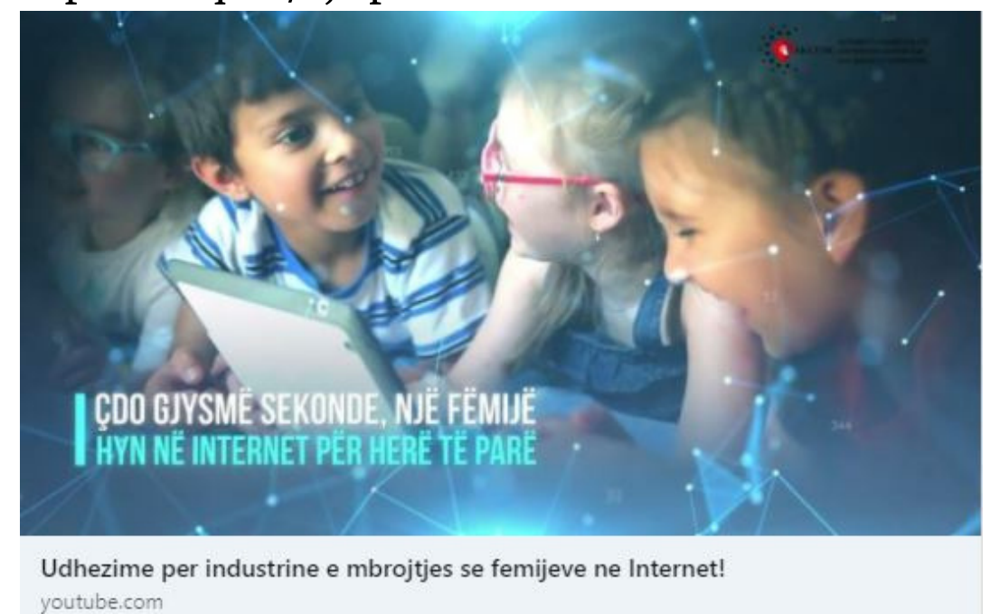
Udhezime për industrinë e mbrojtjes së fëmijëve në Internet! youtube.com

Autoriteti Kombëtar për Certifikimin Elektronik dhe Sigurinë Kibernetike në marrëveshje bashkëpunimi me Unionin Ndërkombëtar të Telekomunikacionit (ITU) në kuadër të programit global të ITU-së për mbrojtjen e fëmijëve në internet ka zhvilluar video ndërgjegjësuese "Si ta mbronni fëmijën tuaj dhe të jeni të vetëdijshëm për atë që ai/a jo po akseson në internet!".