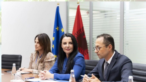
Zëvendës Kryeministrja Znj. Belinda Balluku viziton Qendrën Operacionale të Sigurisë Kibernetike

Samiti, i organizuar nga Qeveria Estoneze, nën kujdesin e Kryeministrit Kaja Kallas, mbledhi përfaqësues të rëndësishëm të fushës së sigurisë kibernetike, me qëllim forcimin e bashkëpunimit, adresimin e sfidave dhe identifikimin e mundësive të reja, për një të ardhme digjitale më të sigurt.